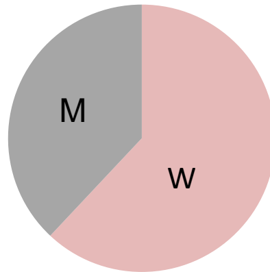
Kollegiaten 2. Jahrgang